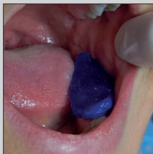
2 Positionnement en bouche