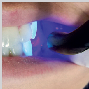
4 Photopolymérisation en occlusion du Picobello Form