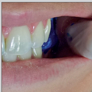
3 Mise en occlusion