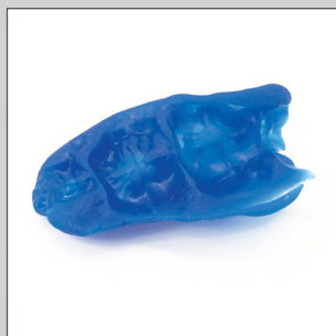
6 Photopolymérisation extra-orale pour la finition. Mordu fini et rigide, qui permet un repositionnement exact